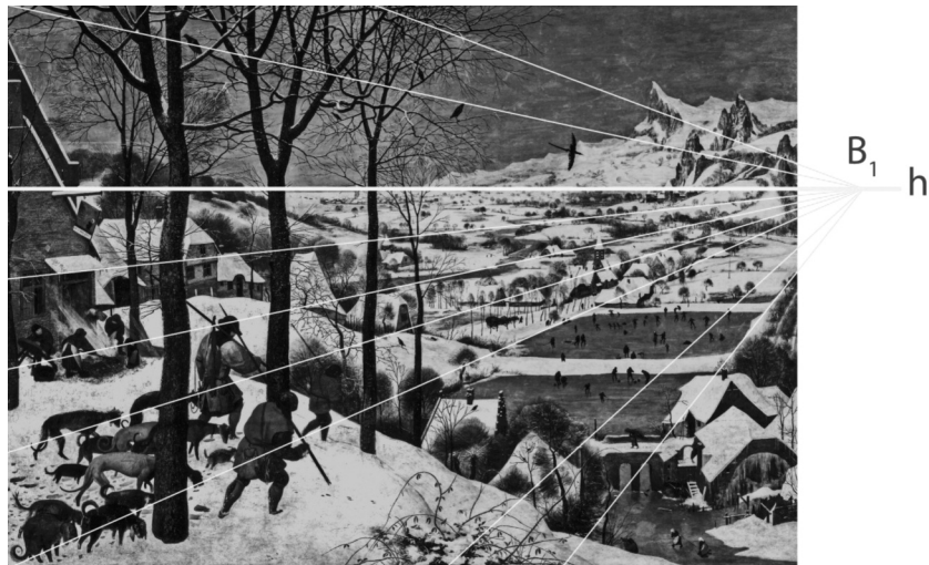
Perspektiva na Lovcih v snegu

prašiča, in proti desni v ozadju ljudje, ki hodijo, se drsajo oziroma igrajo hokej na zamrzlih bajerjih, kar je postal sploh najbolj priljubljen zimski prizor v žanrskem slikarstvu. Toda sugestija gibanja izhaja tudi od kompozicijskega ritma štirih visokih dreves. Ta s tem, da se postopno manjšajo, ne samo da odpirajo prostor v globino, ampak se tudi v enakomernih raztežajih spuščajo po hribu navzdol.