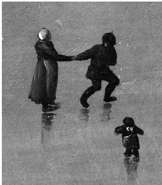
Detajl z Lovcev v snegu

primeru pa zato, ker je majhnost figur glede na format oblikotvorna predpostavka za njihovo številnost in gostoto. V obeh primerih je slikarsko razumljivo, da karakterizacija mnogih figur na ravni obrazov ni smiselna niti mogoča, je pa, kot si ugotovil, učinkovita na ravni karakterizacije celopostavne figure. In Bruegel je bil v tem res mojster. Na njegovih slikah imajo tudi najmanjše figure jasno prepoznaven značaj, čeprav skorajda nimajo obrazov in omembe vrednih detajlov. To je dobro vidno pri figurah v bolj oddaljenih planih.