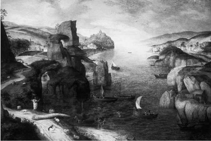
Pieter Bruegel starejši, Pokrajina s Kristusom, ki se je prikazal apostolom na Tiberijskem morju , 1553

penskem grafiku, slikarju in grafičnem založniku Hieronymusu Cocku. V njegovi delavnici je spoznaval skrivnosti tehnik visokega in globokega tiska (lesoreza, bakroreza, suhe igle) in predvsem delal za zaslužek, saj je bilo od ene grafične matrice mogoče dobiti tudi do sto kakovostnih odtisov. Prednost tega je bila, da so bili grafični listi kljub dolgotrajni pripravi razmeroma poceni. Ljudje so jih radi kupovali, ker so bili cenovno dostopni, grafikom pa so zaradi velikih naklad kljub nizkim cenam prinašali lep zaslužek. Leta 1551 je Bruegel postal slikarski mojster in član antwerpenske gilde sv. Luke.