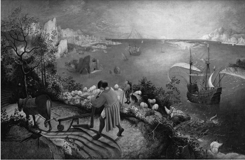
Pieter Bruegel starejši, Pokrajina z Ikarovim padcem , ok. 1561–1565

malo pred drugo svetovno vojno videl Brueglovo sliko, govori o tem, kako dobro so stari mojstri razumeli tek sveta. Ob trpljenju, ki ga povzroči veliko dejanje ali dogodek, so namreč prikazovali ravnodušnost. Audnov zgled starega mojstra je Bruegel, pri katerem takšno trpljenje nima prič. Zraven – vendar samo in nič drugega kot to: zraven – so otroci, ki se drsajo po ribniku, psi, ki po pasje živijo naprej, ali konj, ki si drgne zadek ob drevo. Vse to so detajli z Brueglovih slik. Seveda pa je v Audnovi pesmi kot kronska priča človeške ravnodušnosti nazadnje tu Pokrajina z Ikarovim padcem , na kateri “se vse obrača / proč, prav lagodno, od nesreče”: 16 tako orač, čeprav je moral slišati pljus ob Ikarovem padcu v vodo in njegov krik, kakor tudi – ribiča in pastirja Auden preskoči – ladja, ki gre mirno svojo pot.