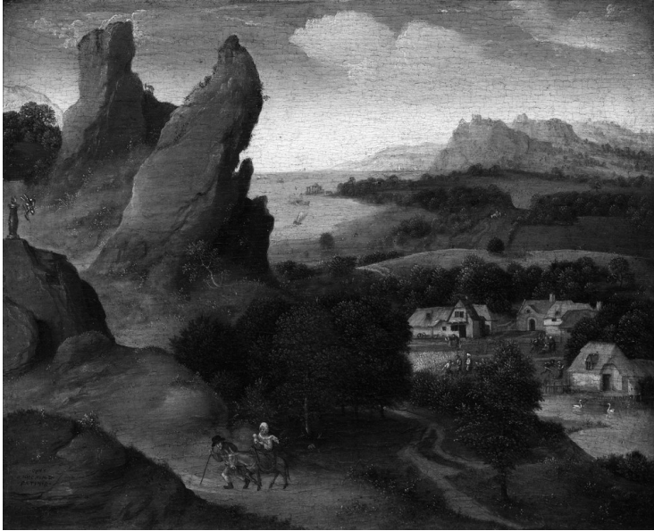
Joachim Patinir, Pokrajina z begom v Egipt , 1516/17

prej videti tako, kakor da bi smrti izrekli šah in mat: vsak dan ima svoj strup, za tistega, ki zna videti, pa tudi protistrup. 18