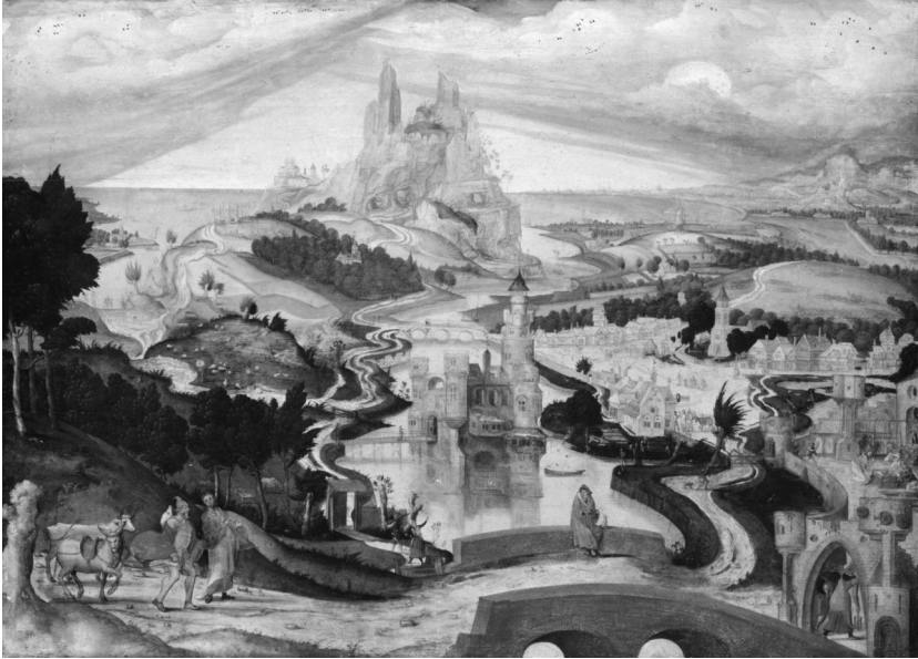
Mojster LC, Prihod v Betlehem , ok. 1540

Rekonstrukcija slike tega mojstra je pokazala, da je bilo na risbi spodaj več prizorov iz Kristusovega življenja. Te je mojster zamenjal s prizori iz vsakdanjega življenja in sveti družini na končani sliki odmeril razmeroma malo prostora levo spodaj. Bruegel pa je šel še dlje. Na sliki Popis v Betlehemu , recimo, je biblični dogodek zajel ter, še več, skril med vsakdanje pripetljaje in opravila.