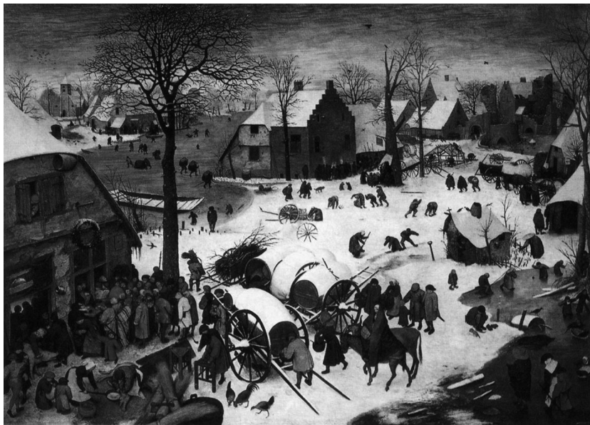
Pieter Bruegel starejši, Popis v Betlehemu , 1566

To je edina ohranjena Brueglova slika z mitskim motivom. Bruegel je pripoved o Dedalovem in Ikarovem letu poznal iz Ovidijevih Metamorfoz , v katerih ima ta neverjetni let priče. Kdor ju je videl leteti, pripoveduje Ovidij, ribič, pastir ali orač, je osupnil in pomislil, češ, to morata biti bogova. 15 Nasprotno je Bruegel mitsko preteklost zvrnil v sedanjost in herojstvo v vsakdanjost. Na njegovi sliki je véliko mitsko dejanje kratko malo postavljeno ob vsakdanja opravila. Natančneje: na njej sploh ni prikazan Dedalov in Ikarov let, ampak samo Ikarov padec, od vélikega dejanja samo njegov žalostni ali celo tragični konec.