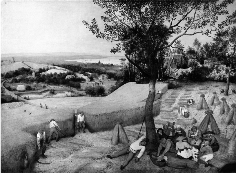
Pieter Bruegel starejši, Žanjci , 1565