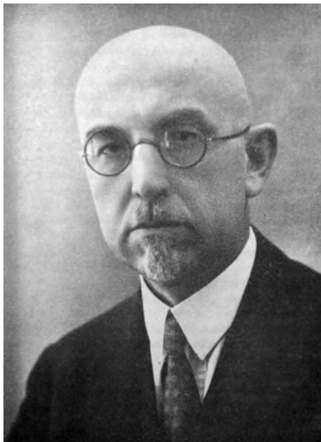
SLIKA 1: A. V. MAKLECOV

dij je leta 1908 zaključil z odliko in dobil zlato medaljo za nalogo z naslovom, ki že napoveduje njegovo poznejše življenjsko zanimanje: "Vrste krivde v kazenskem pravu". 4