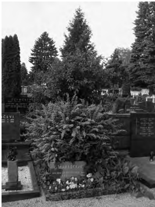
SLIKA 5: GROB A. V. MAKLECOVA IN LILIJANE MAKLECOVE NA LJUBLJANSKIH ŽALAH

izdajalcem, na strani družbenega napredka, na strani borbe za lepši in pravičnejši družbeni red. V njem je rasla vera, da tedaj, ko bo ta red ustvarjen, ne bo več socialno in moralno ogroženih, za katere se je vedno zavzemal.” 46