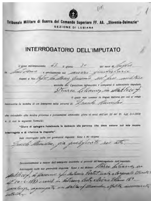
SLIKA 2: FOTOGRAFIJA DOKUMENTA Z ZASLIŠANJA KVESTURE LILIJANE MAKLECOV (VIR: ARHIV REPUBLIKE SLOVENIJE, AS 1791, VOJAŠKO SODIŠČE 2. ARMADJE)

frankoruskega inštituta v Parizu in kriminalno-biološkega društva v Gradcu. 21