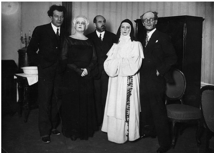
SLIKA 5: Nablocka v vlogi baronice Castelli

je bila opazna. “Zelo karizmatična. Njo si čutil. Samo stala je na odru, pa si že postal pozoren.” 43