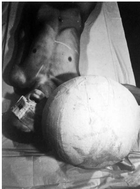
SLIKA 1: fotografija iz razstavnega kataloga: Documenta 5: Befragung der Realität: Bildwelten heute , Kassel, Documenta, 1972, str. 73.

razmerju do telesa jasen tujek. Zaradi velikosti, sterilnega videza in prostorske utesnjenosti kroglja učinkuje, kot da utegne glavo potisniti nekoliko stran in streti. Zgornji del desne rame je prekrit s krogljo, vidimo le del komolca. Gledalec ima občutek, kot bi predmet z lastno težo in velikostjo priščipnil del telesa, ga ukleščil in zmečkal, saj telo na fotografiji dejansko prihaja v vidni kader izza/izpod kroglje. Drugo pomembno razmerje se oblikuje na ravni povijanja telesa z medicinskimi materiali. Ležeče telo ima povito glavo, oko pa zatesnjeno z obloženo kompresijsko obvezo, ki nakazuje poškodbo obraza in oslepitev, a tudi kroglja kot vzporedna simbolizacija sočasno celovitega in poškodovanega telesa je popolnoma povita z gazo. Z neprestanim, obsesivnim povijanjem telesa Schwarzkogler objektivizira obolele, ranjene ali manjkajoče dele; v tem smislu je tematiziral tudi oslepitev, kastracijo, krvavenje, hospitalizacijo in