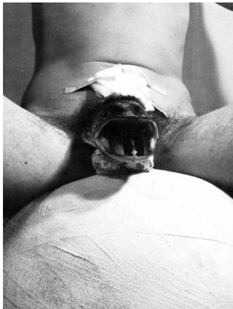
SLIKA 5: Rudolf Schwarzkogler, 3. Akcija, črno-bela fotografija (Ludwig Hoffenreich) 38,9 x 29,2 cm (arhiv avtorice).

pri njegovem delu, pridobi asociativno moč. 22 Če Schwarzkoglerjeve fotografije, predstavljene na Documenti 5 , povežemo v njegov širši opus fotografske serije od 2. do 4. akcije iz leta 1965, lahko prepoznamo njegovo nenehno obravnavo in serijsko ponavljanje rane, poškodbe očesa ali asociativne pretvorbe moškega v ženski genitalni organ; poškodba in odstranjevanje penisa sta vodilni motiv žive rane, ki procesualno vodi v smrt. Pogosti rez po zgornjem delu trupa brez glave in rok ponovno zasledimo na sliki go-