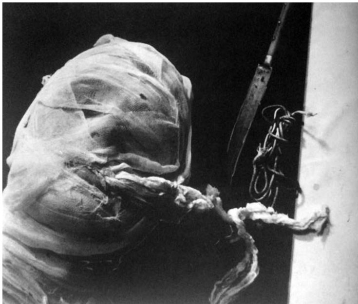
SLIKA 3: Rudolf Schwarzkogler, fotografija iz razstavnega kataloga: Documenta 5: Befragung der Realität; Bildwelten heute , Kassel, Documenta, 1972, str. 73.

Hitro prepoznamo, da telo ni v pokončnem položaju, ujeto je ležeče. Tokrat sta glava in vrat popolnoma zakrita z belo krpo; figura je nema, brez zavesti ali mrtva, na obrazni del je položen splet električnih kablov. Na videz nedolžni predmeti zdrsnejo v asociativno povezavo z instrumenti električnega šoka, telesnega zavezovanja, mučenja in davljenja. Schwarzkogler problematizira telo medicinskega nasilja, navidezno brez znakov življenja, kot prikazuje izsek popolnoma zastrte, s povoji zatesnjene glave, ki v kader nenavadno prihaja z levega spodnjega kota (slika 3).