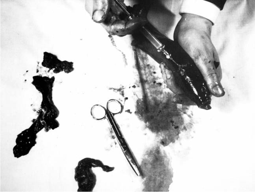
SLIKA 6: Rudolf Schwarzkogler, 2. Akcija, črno-bela fotografija (Ludwig Hoffenreich) 17,8 x 23,5 cm (arhiv avtorice)

povzroči udarnino, ki sproži delovanje psihičnega spomina. 23 Pri Schwarzkoglerju je forma rane zevajoča in grozeča živa odprtina, predrtina v telo; videnje nezaustavljenega krvavenja pa nam potencirajo in izostrijo različne oblike sterilne gaze, kompresijske obveze, obliži in drugi sanitarni materiali. Meseno tkivo zaznavamo vzporedno s predmeti, kot madež na površini gaze ali kot drenažo za odvajanje izcedka. Schwarzkoglerjeva rana ne poruši zgolj idealnega likovnega telesa, temveč ustvarja zabrisano in tesnobno mejo med notranjim in zunanjim telesom, med življenjem in smrtjo.