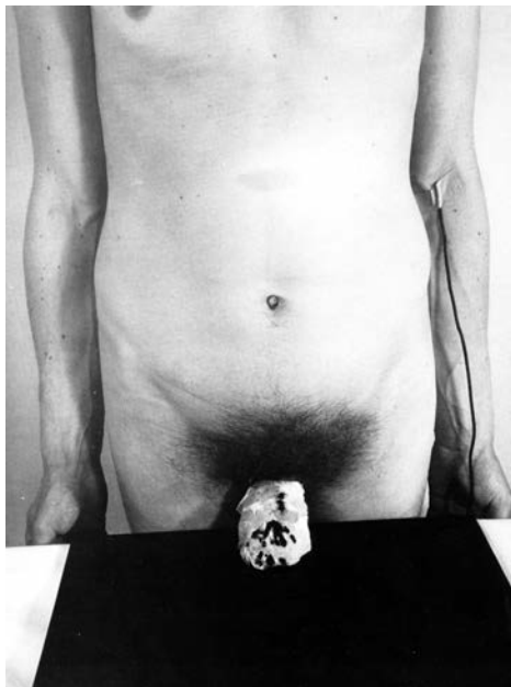
SLIKA 4: Rudolf Schwarzkogler, fotografija iz razstavnega kataloga: Documenta 5: Befragung der Realität; Bildwelten heute , Kassel, Documenta, 1972, str. 73.

renzičnih preparatov. Telo v stoječem položaju je anonimni predmet organiziranega anatomskega ogledovanja (slika 4).