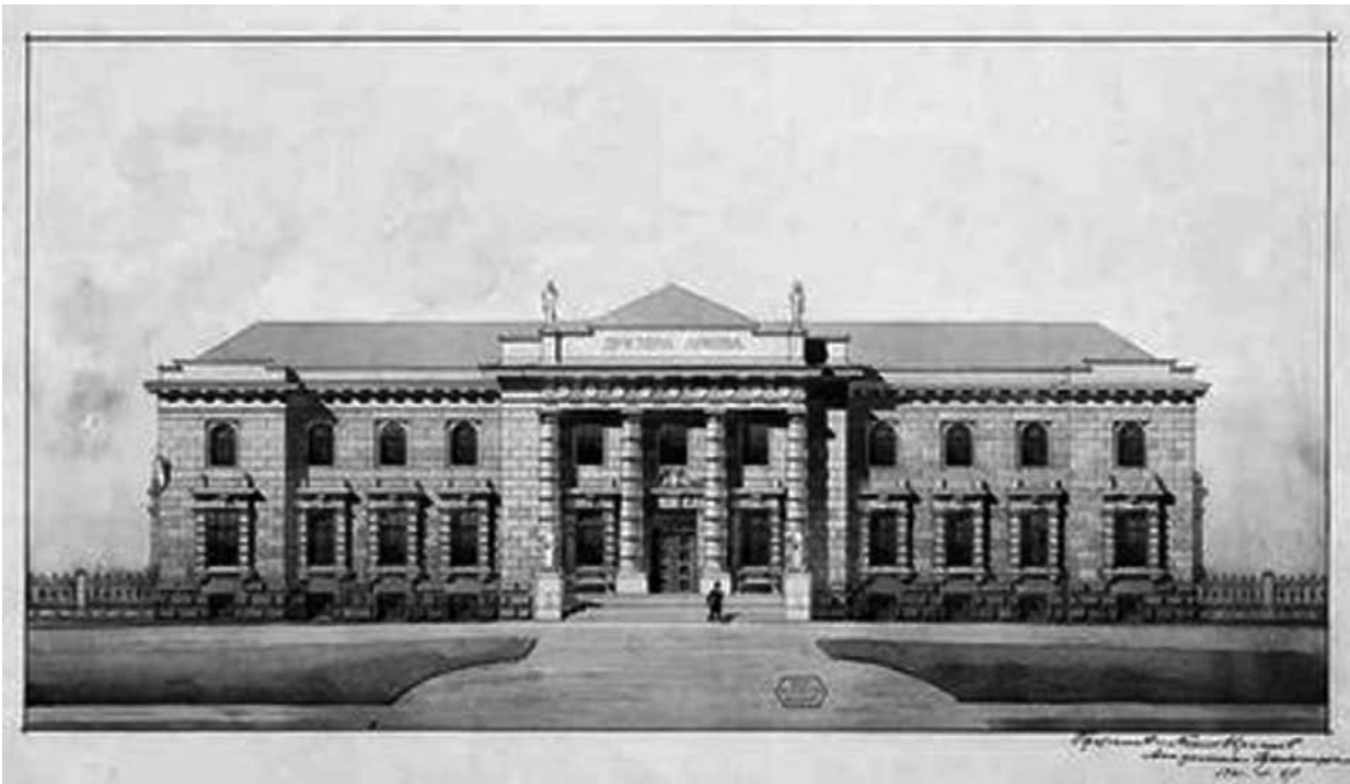
Slika 2: Crtež fasade zgrade Arhiva Srbije, rad arhitekta Nikole Krasnova