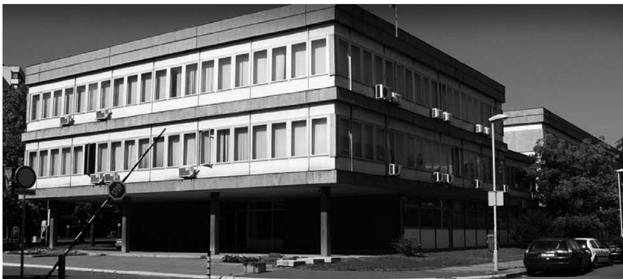
Slika 4: Zgrada Istorijskog arhiva Beograda

Istorijски arhiv grada Beograda je jedan od najmodernijih u zemlji, a povod za nastanak ove institucije bio je, pre svega, da se zaštiti i sačuva izuzetno značajna građa Zemunskog magistrata, nastala još u XVIII veku. 1963. napravljen elaborat za namenski objekat, po projektu arhitekte Milana Jerkovića. U periodu od 1969. do 1972. godine zgrada je sazidana. Površina terena na kome je sazidan objekat iznosi 7200 m 2 , od toga 4700 m 2 korisne površine, i to: kancelarije, hodnici i druge prostorije 1500 m 2 , radionice 480 m 2 , čitaonica 120 m 2 , galerija 200 m 2 , depoi 2400 m 2 . http://www.arhiv-beograda.org/index.php/sr/o-nama/istorijat