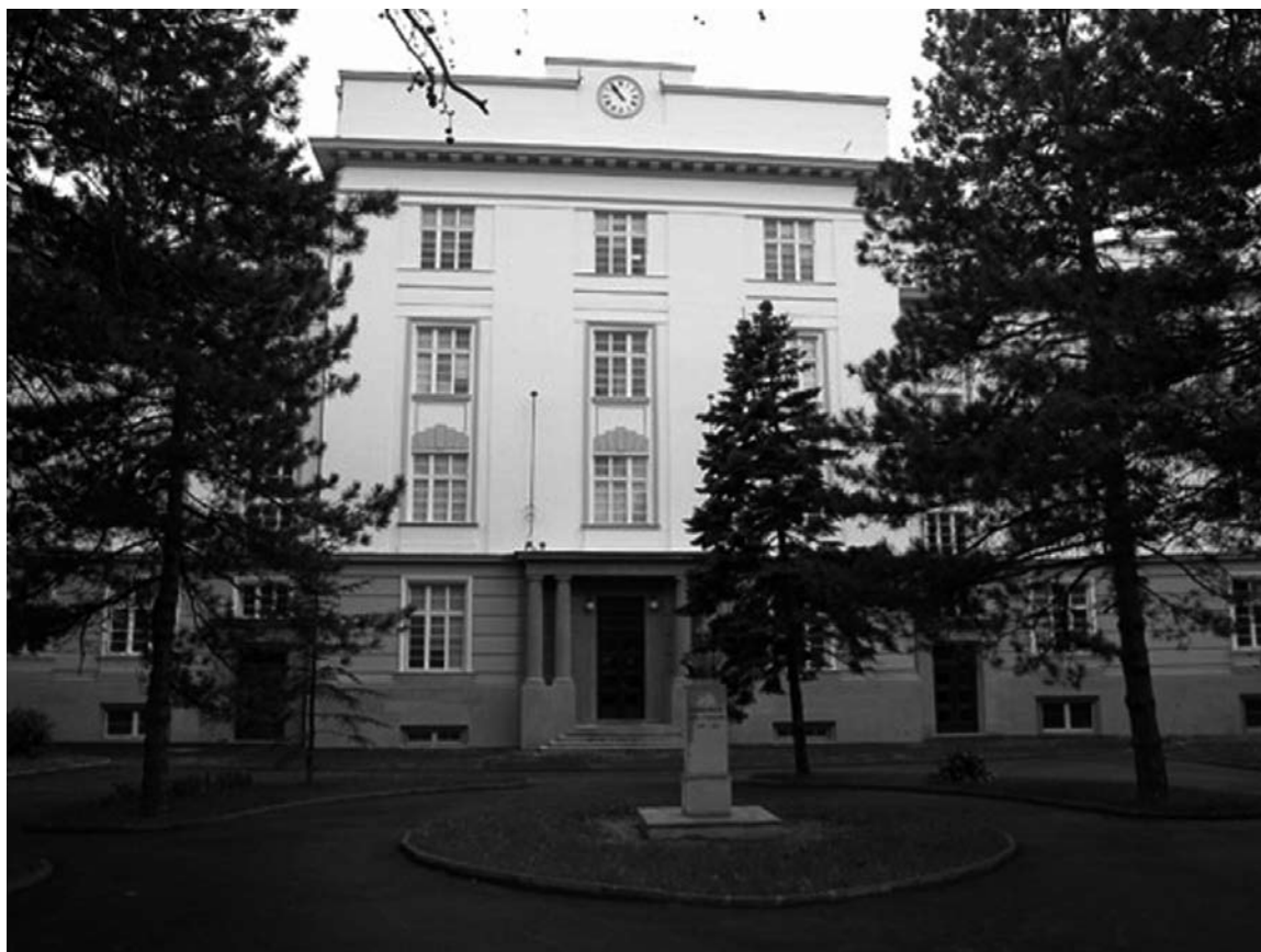
Slika 1: Zgrada Arhiva Jugoslavije

Zgrada Arhiva Jugoslavije u ulici Vase Pelagića 33u Beogradu je jedna od retkih koja zadovoljava uslov zaštitne zone mada nije reč o namenski rađenom objektu. Izgrađena je na uzvišenju daleko od vodenih tokova i podzemnih voda, na velikom placu tako da se ne graniči sa drugim obkekatima već je okružena velikim dvorištem i zelenilom..Zgrada Arhiva Jugoslavije izgrađena je kao zadužbina kralja Aleksandra i Karađorđevića, a po projektu arhitekta Vojina Petrovića. Trospratna zgrada oblikovana je u stilu akademizma, korisne površine oko 8.000 kvadratnih metara, sa glavnom fasadom okrenutom prema Topčiderskoj zvezdi. Prvobitno je bila zgrada Doma kralja Aleksandra I za učenike srednjih škola. Arhiv Jugoslavije je dobio ovaj objekat 1969.godine. www.arhivynika.u.gov.rs/.../st...arhivu/zgrada_arhiva/istorijat_zgrade.html .