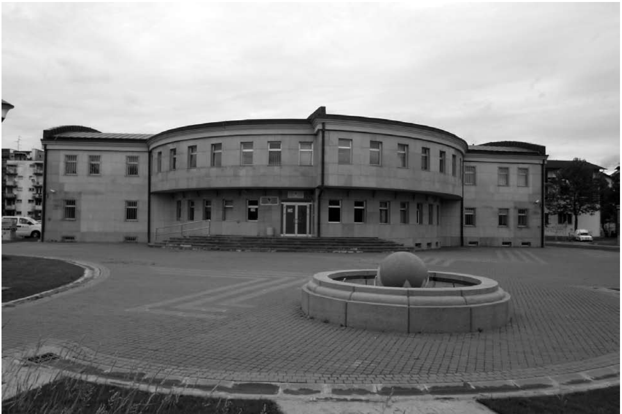
Namjenski izgrađen objekat za Arhiv Brčko Distrikta Bosne i Hercegovine